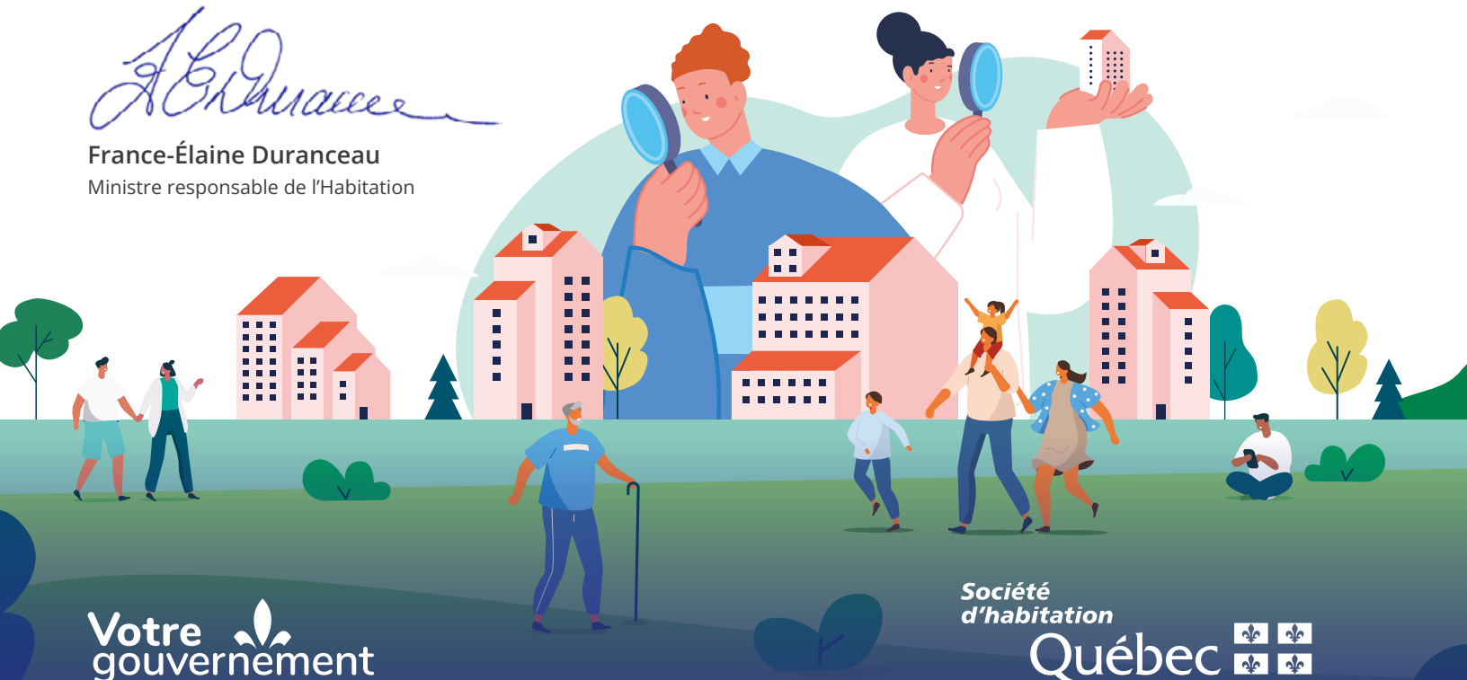
France-Élaine Duranceau Ministre responsable de l'Habitation

Merci de nous aider à mieux loger les Québécoises et les Québécois.