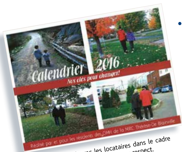
Calendrier réalisé avec les locataires dans le cadre de la campagne de sensibilisation au respect.

Nous trouvons dommage que le projet tire à sa fin, mais nous pouvons conclure qu'il a permis de valoriser la contribution de nos locataires à leur milieu, de leur donner le goût de mieux s'alimenter, de bouger davantage, de respecter leur milieu de vie et de s'impliquer dans leur communauté en donnant au suivant! ●