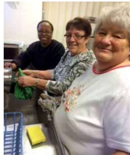
Cuisine collective à l'OMH de Rosemère.

abordés des thèmes variés: yoga du rire, Alzheimer, mourir dans la dignité, etc.;