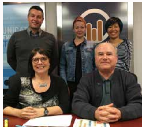
Le comité de sélection ID 2 EM 2017-2018 :

Enfin, à la suite de ses travaux, le comité de sélection a transmis à la fin novembre 2017 ses recommandations à la SHQ, précisant les projets à financer et les montants des subventions à octroyer. Il en résulte que 37 projets ont été recommandés pour recevoir une aide financière. De l'ensemble de ces projets, 18 ont été présentés par des associations de locataires et 19 par des offices d'habitation. Il reste à la SHQ d'autoriser le financement des projets retenus et de faire parvenir les réponses (lettres d'acceptation ou de refus) aux organismes demandeurs, ce qui devrait être fait en début d'année (janvier 2018) selon l'échéancier établi. •